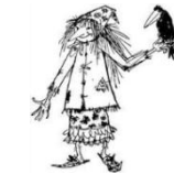
„51 Stufen Kino“

Wann? Mittwoch, 04.04.18 Treffen: 15.50 Uhr Wer? 5. und 6. Klasse Wo? 51 Stufen Kino im Deutschen Haus