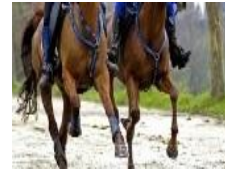
„Ausflug zum Ponyhof“

..... (Unterschrift der Eltern/Sorgeberechtigten und E-Mail-Adresse)